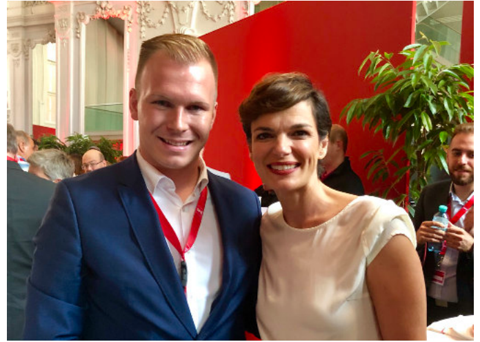
Begegnung mit Pamela Rendi-Wagner