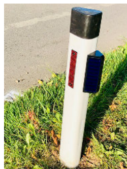
Sicherheit auf den Straßen erweitert – Wildwarnreflektoren (Untere Dorfstraße)