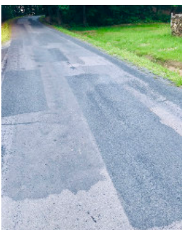
Sanierung der Straßen im Gemeindegebiet