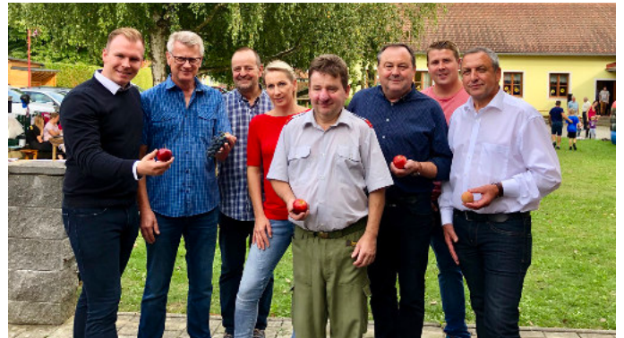
Gesundheitstag 2019 in Mühlgraben