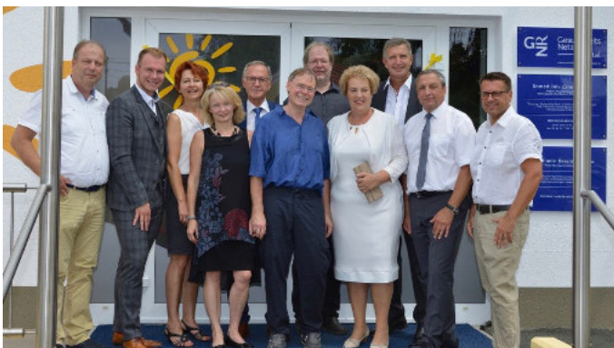
Eröffnung Lebensmittelpunkt – GesundheitsNetzwerk Raabtal