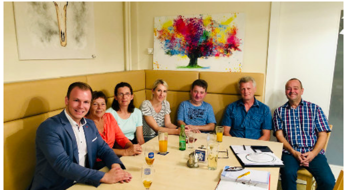
Arbeitskreis Gesundes Dorf – Vorbesprechung zum Gesundheitstag