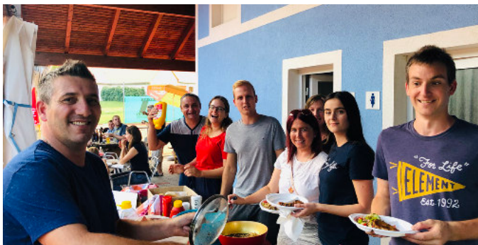
Vereinsmeisterschaften mit geselligem Abschluss