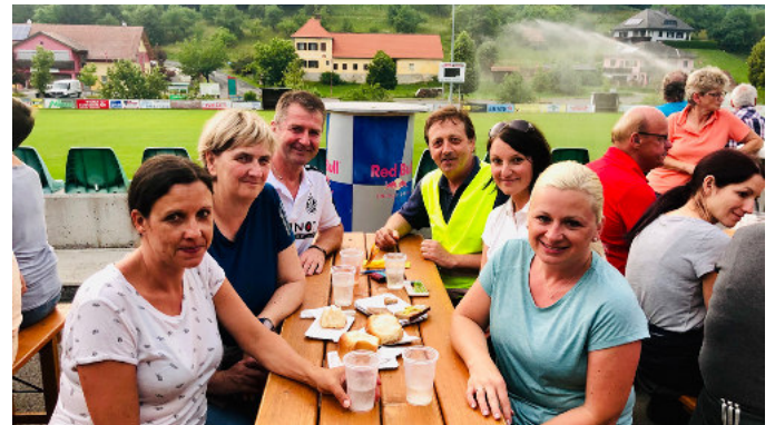
Vollmondwanderung in Mühlgraben