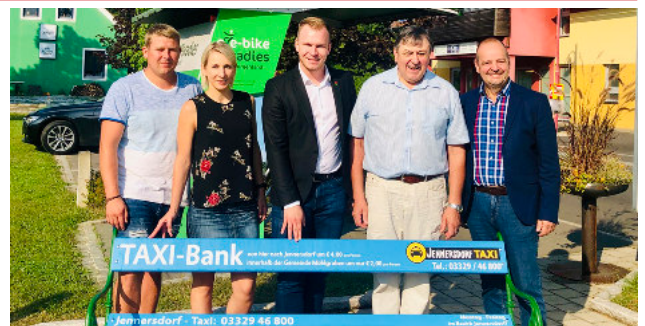
Das Jennersdorf TAXI wird gut angenommen – Rufnummer 03329 / 46 800