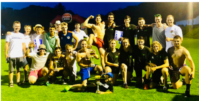
Bubble Soccer Turnier 2019