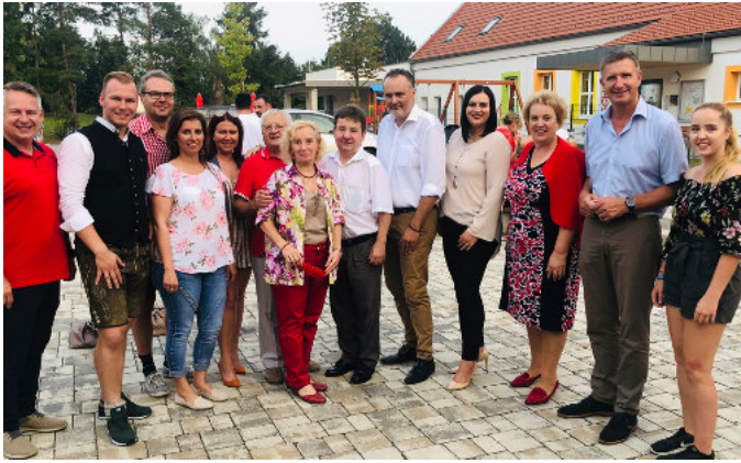
LH Hans Peter Doskozil auf Burgenlandtour im Bezirk Jennersdorf (Heiligenkreuz i. L.)