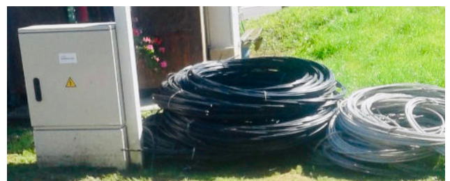
Vergrabung der Strommasten (Grenzweg, Tostlerreck)