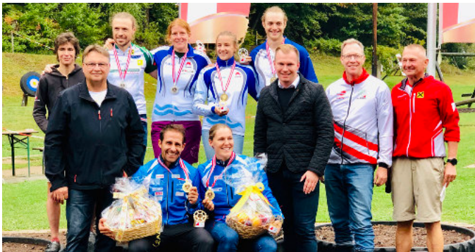
Österreichische Staatsmeisterschaft im Orientierungslauf – Mühlgraben / St. Martin a. d. R.