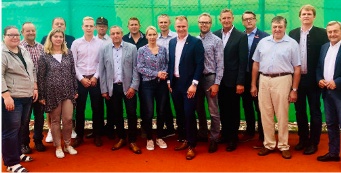
Platzeinweihung mit Dämmerschoppen