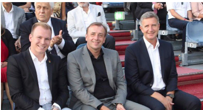
jOPERA Premiere „MARTHA“ auf Schloss Tabor