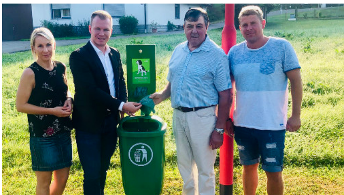
Hundestationen wurden aufgestellt