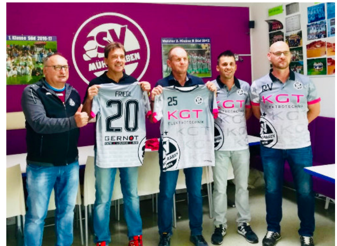
Neue Dressen gesponsert von KGT Elektrotechnik und Gernot